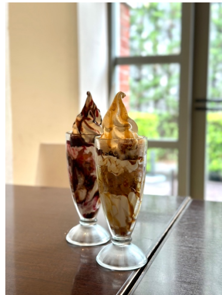
寒梅館 Hamac de Paradis 的芭菲 學校的 café 有芭菲賣這件事真的很神奇！