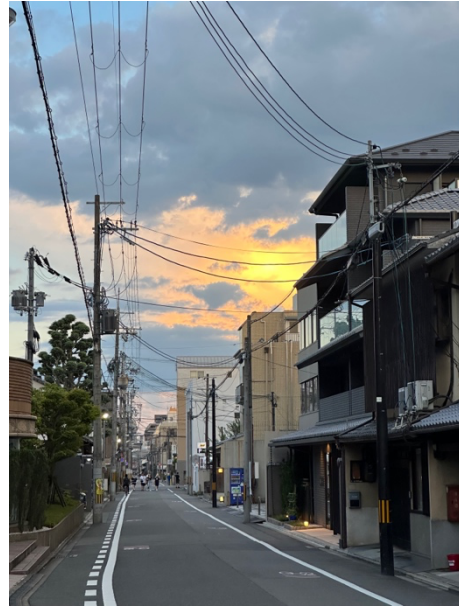
從丸太町往宿舍的路上