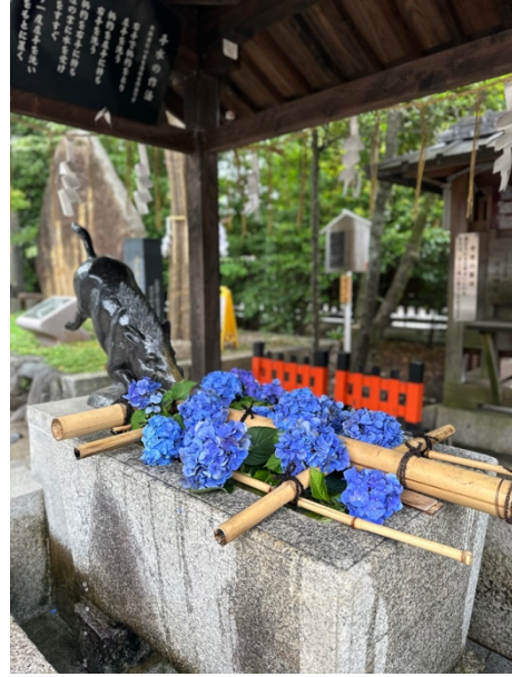
宿舍旁護王神社的花手水